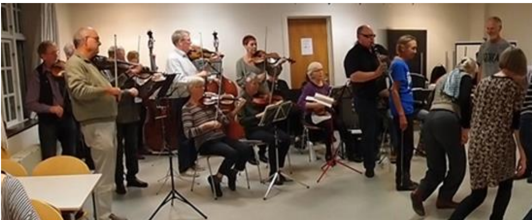
Ramsø Spillemandslaug til onsdagsaften i Roskilde 28. oktober.

NB sidste nyt: Ramsø Spillemandslaug deltager også!