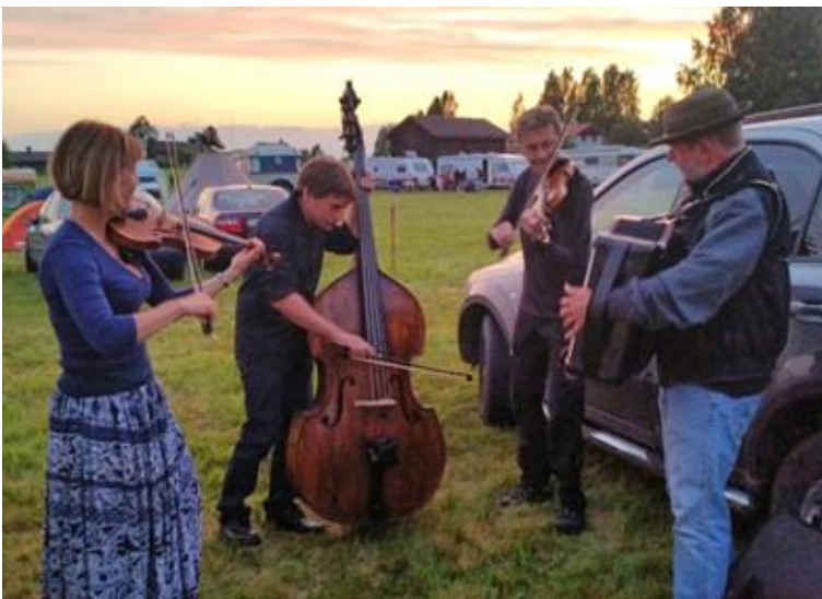
Elvings Spelmanskapell (S)

Her er nogle af de mange spillegrupper, du kan opleve på årets stævne: