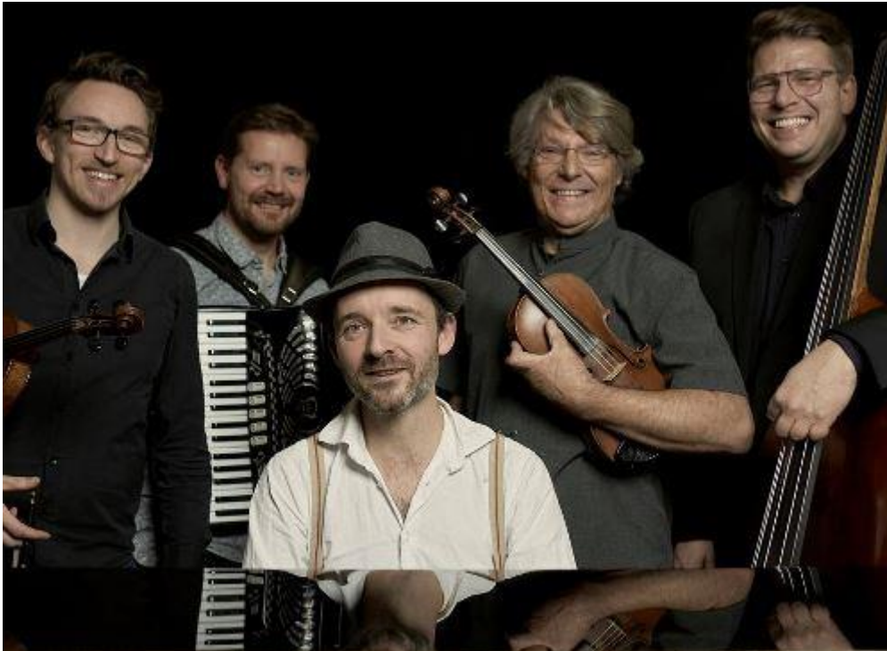
Fionia Folk Brothers

Aftenens balforløb bliver tilrettelagt efter stemningen i salen, således at både dansere og musikere kan nyde en afslappet aften i godt selskab.