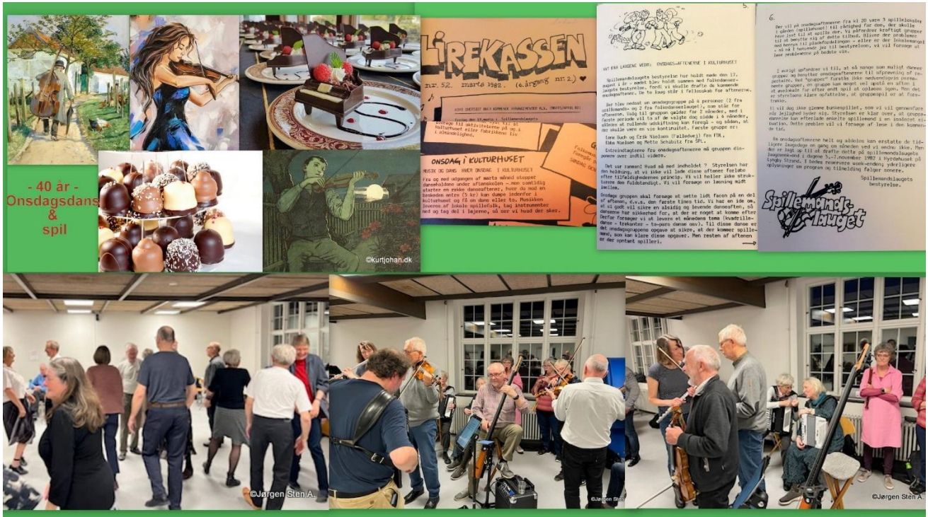
Dejligt at se så mange dansere og spillefolk ved onsdagscaféens 40-års jubilæum.

Onsdag den 6. april: Efter spillemandslaugets laugsaften marcherede alle musikerne spillende - på melodien Anglaise - ind i danselokalet! Og de mange fremmødte publikummer klappede spontant i takt. En festlig start på fejringen af, at det var 40 år siden, at onsdagscaféen blev startet på Prindsen.