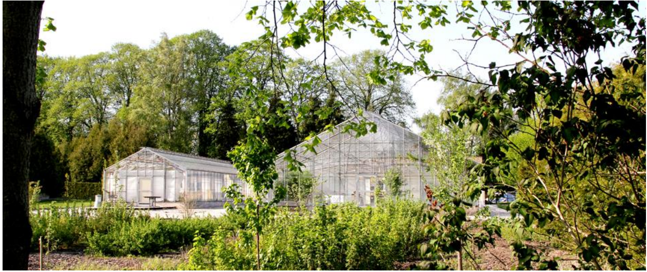
Sct. Hans Have

Spillemandslauget og folkedanserlauget yder begge økonomisk støtte til folkemusikfesten - tak for det.