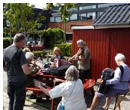
Buskspil på Østervangsskolen