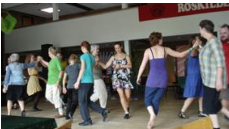
Workshop i rækkedanse lørdag eftermiddag