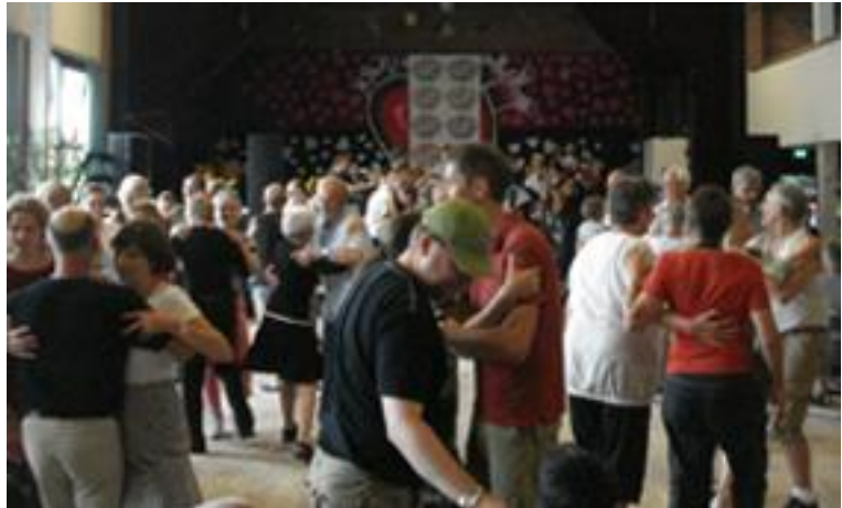
Trængsel på dansegulvet på Østervangsskolen

Roskilde Spillemands­laug åbner ballet lørdag aften