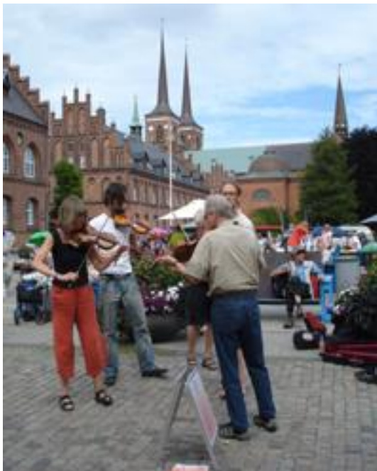
Lørdag formiddag i byen