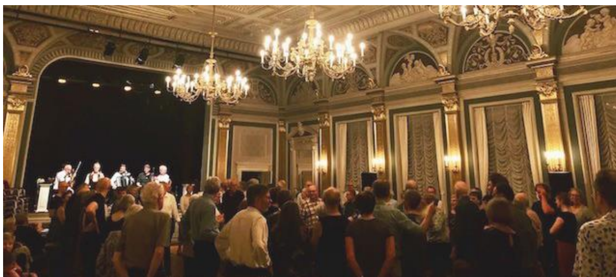
Foryggende danseaften - alle kan deltage.