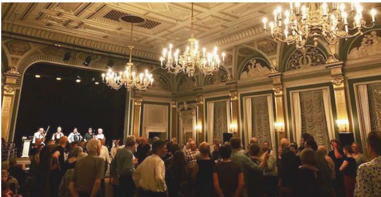
Førrygende danseaften - alle kan deltage.